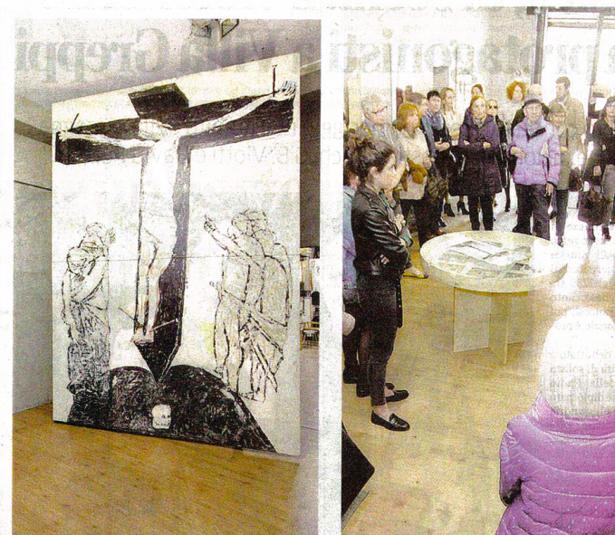
Una delle opere esposte alla galleria Bellinzona