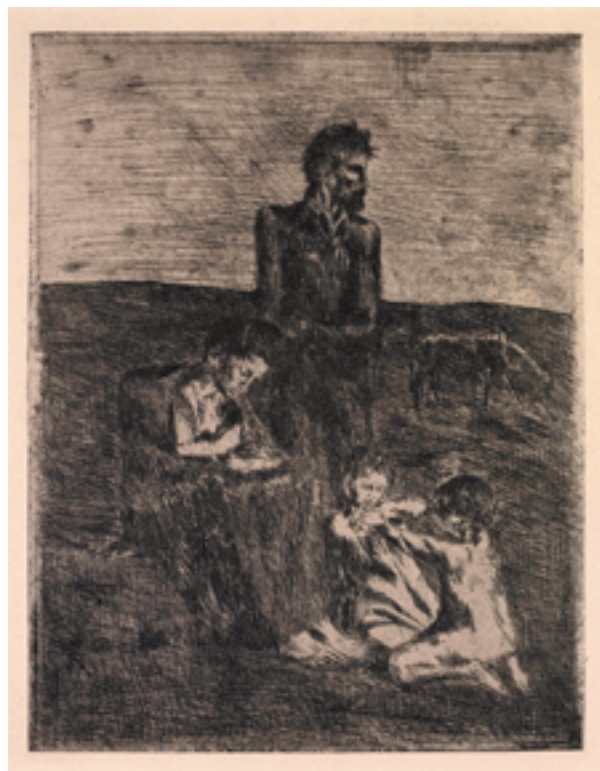
Les pauvres , 1905, acquaforte, mm 236x180 (da "Saltimbanques")